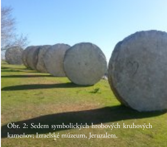
Obr. 2: Sedem symbolických hrobových kruhových kameňov; Izraelské múzeum, Jeruzalem.

6 To, čo robil Ježiš, robili aj učeníci. Peter vzkriesil Tabitu (Sk 9). Podľa fámy