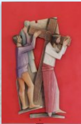
PÁNU JEŽIŠOVI NIEŠŤ KRÍŽ

Jedným z najvýrečnejších prejavov kresťana je pomoc . Kristus prijal pomoc pri nesení kríža od Šimona z Cyrény.