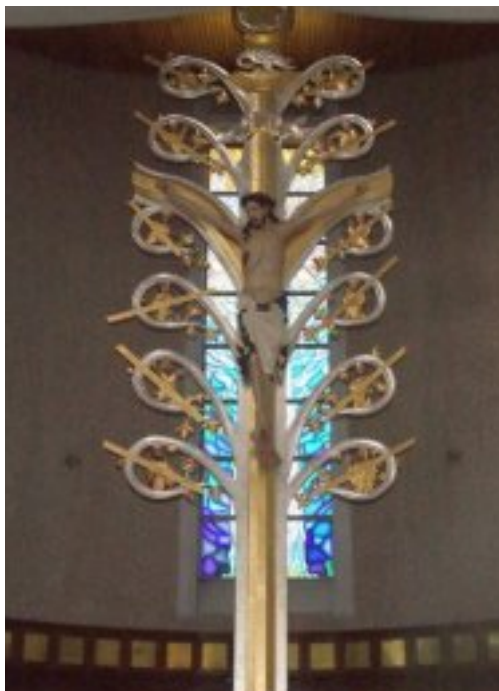
Foto: Kríž - strom života, v bazilike sv. Jakuba v meste Toruń.