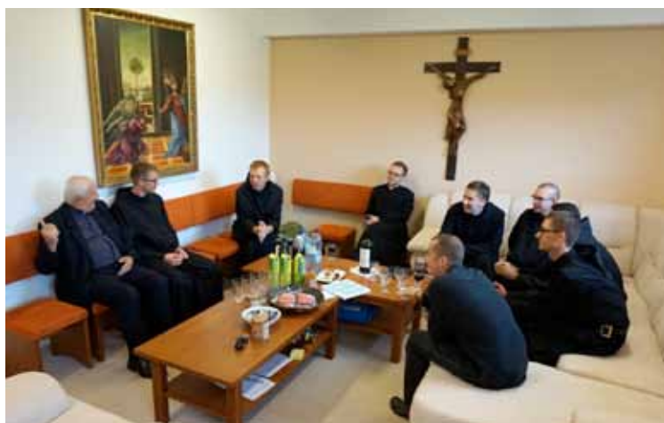
Naša nová upravená rekreačná miestnosť.