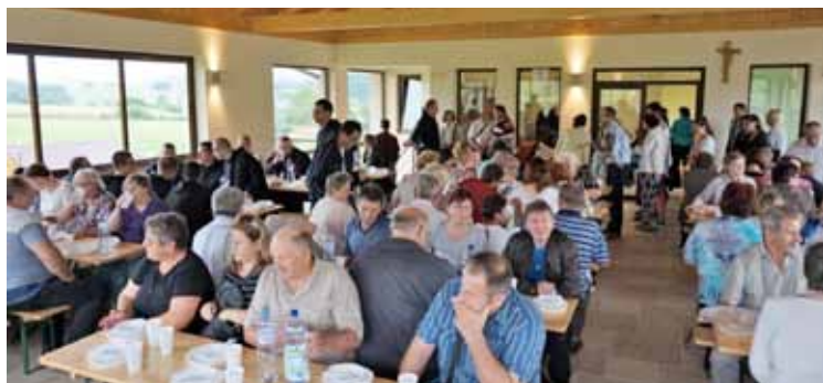
Po slávnosti Premenenia Pána bolo pohostenie v Dome chleba na oboch terasách.