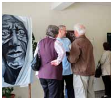
Návštevníci pri výstave Tváre otcov púšte.