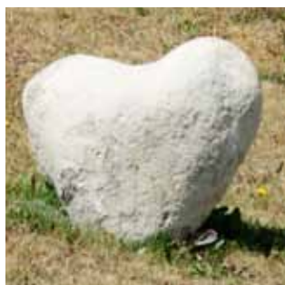
Toto srdce sa našlo pri kláštore v potôčiku, vytvorené bez ľudskej ruky...